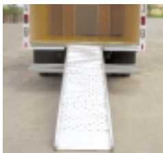
Rampe coulissante en aluminium

Certains équipements disponibles. Pour plus de détails, visitez notre site web au: www.unicell.com