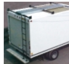
Support d'échelle monté sur le toit