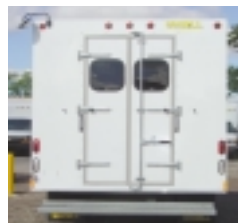
Portes pivotantes arrière étroites avec fenêtres